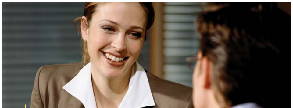
Hochqualifizierte Frauen in der Familienphase im Beruf halten

noch mehr Nachwuchs auszubilden. Ein Drittel der Dienstleister setzt die Vereinbarkeit von Familie und Beruf ganz oben auf die Tagesordnung. In der Industrie wollen 25 Prozent der Befragten mehr ältere Arbeitnehmer beschäftigen. Der Jugendwahn ist verrauscht. Kurzum: Bildung – und hierbei nicht zuletzt Weiterbildung – ist wichtiger als je zu vor. Gerade bei den Hochqualifizierten übersteigt schon jetzt – und erst recht künftig – die Nachfrage das Angebot. Der OECD-Bildungsbericht beweist, dass in Deutschland der Anteil der Hochqualifizierten im Vergleich zu anderen Industrienationen relativ gering ist. Es gibt hier noch „Luft nach oben“. Die Firmen bemühen sich nicht zuletzt deshalb, hochqualifizierte Frauen in der Familienphase im Betrieb zu halten. Weiterbildung, die begleitend zu Beruf und/oder Familie wahrgenommen werden kann, hat also gute Konjunkturaussichten. ■